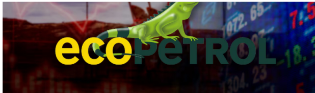
El grupo anunció que se logró superar las metas propuestas en diversos puntos del sector energético del país.

Por otro lado, el presidente de Ecopetrol envió un fuerte mensaje a las voces que han criticado las labores realizadas , señalando que las personas que indican que se ha marchitado el grupo deben conocer los logros generados y las inversiones en materia exploratoria.