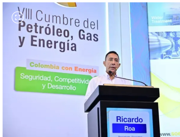
Presidente de Ecopetrol. Ricardo Roa revela lo que se invertirá en la regasificadora de Coveñas.

“Estamos haciendo inversiones de US$175 millones en el propósito de volver mucho más eficiente y optimizada la infraestructura de transporte de crudos y de combustibles, trabajando en proyectos de reconversión”, agregó.