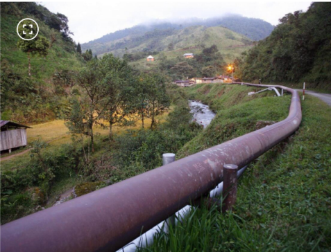
Oleoducto Trasandino de Cenit

¿Por qué la caída en las ganancias de Ecopetrol agravaría la crisis fiscal de Colombia en 2026? Así está el panorama