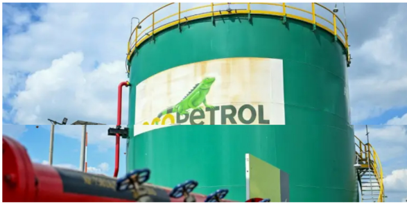
Imagen de un tanque de almacenamiento de petróleo crudo en la planta de la petrolera colombiana Ecopetrol en Acacias, departamento del Meta.

Coveñas y Buenaventura son las apuestas principales de Ecopetrol para "tapar" el hueco de gas natural que tiene el país mientras se concreta la puesta en marcha del mega proyecto Sirius.