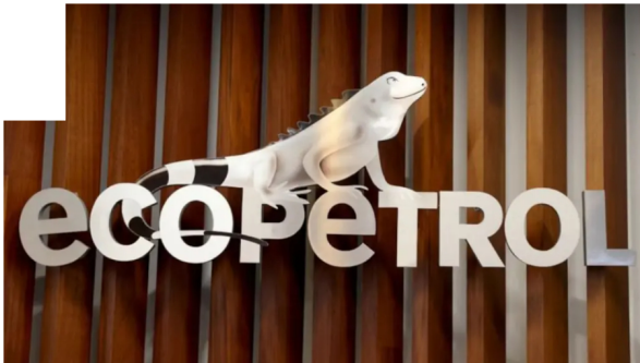
Ecopetrol: análisis de la crisis y futuro energético en Colombia

"De este proceso de Coveñas recibimos unas 40 manifestaciones de interés, ofertas no vinculantes de empresas de todo el mundo con capacidad para tener la FSRU (la unidad flotante), que es el cuello de botella en estos tiempos y en estos programas y proyectos", explicó el presidente de Ecopetrol, Ricardo Roa, en la VIII Cumbre del Petróleo, Gas y Energía.