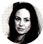
Piedad Urdinola Directora del Dane.

“Si bien, es un resultado positivo en el tercer trimestre, la economía está jalonada por el consumo, especialmente, el gasto del Gobierno. Esto no es sostenible a largo plazo”.