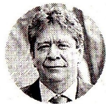
Bruce Mac Master Presidente de la Andi

HACIENDA. UN INFORME DE INVESTIGACIONES ECONÓMICAS DE BANCO DE BOGOTÁ DICE QUE SIN EL GASTO PÚBLICO DEL ESTADO, EL AUMENTO DEL PIB HABRÍA SIDO DE 1,8% Y NO DE 3,6% EN EL TRIMESTRE