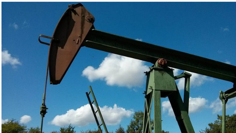
Producción de petróleo y gas.

Por: Manuel Alejandro Correa - 2025-11-18