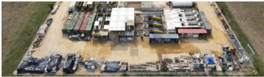
Pozo de Canacol Energy

La CCAA está diseñada para facilitar una suspensión de procesos, dando a la compañía estabilidad y un “respiro” frente a las acciones de los acreedores , mientras desarrolla un plan de arreglo con los acreedores o, de otro modo, lleva a cabo su reestructuración.