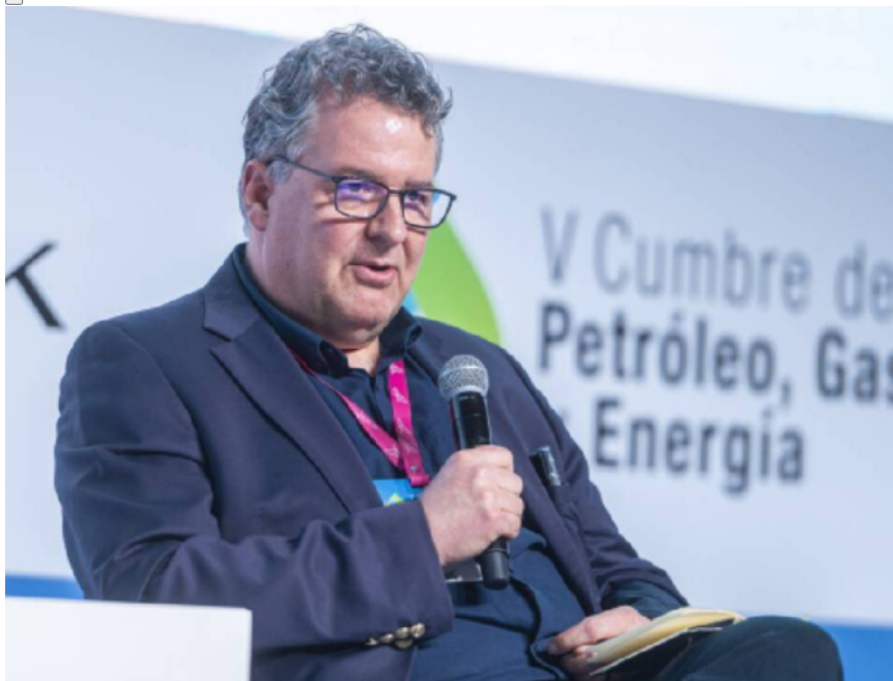
Charles Gamba, CEO de Canacol Energy

La junta directiva consideró todas las demás opciones y concluyó que una reestructuración bajo la CCAA, con protección inmediata frente a los acreedores, es la mejor alternativa .