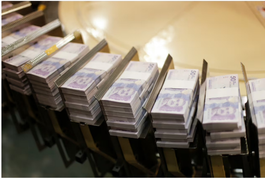
La DIAN y Ecopetrol enfrentados por diferencias tributarias.

De acuerdo con el Ministerio Público, "frente a los cobros de la Dian a Ecopetrol por el pago del impuesto del IVA por las importaciones de combustible que podrían acarrear graves riesgos para la estabilidad financiera de la empresa , la Procuraduría General de la Nación convocó a una reunión de urgencia para buscar una salida al pleito fiscal".