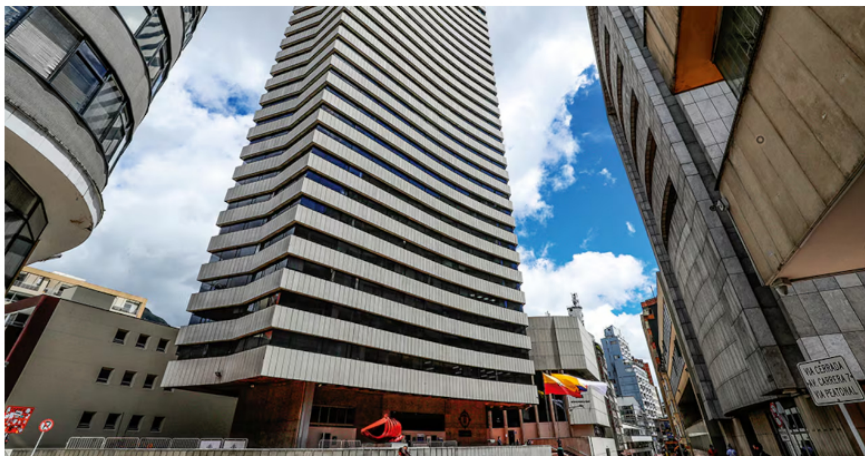
La Procuraduría puso la lupa en caso DIAN- Ecopetrol .

Agregó la Procuraduría que: "en la mesa técnica, citada para el 19 de noviembre y en la que tendrán asientos representantes de cada una de las entidades, se analizarán los nuevos elementos presentados y los fundamentos jurídicos y doctrinales de las actuaciones en curso".