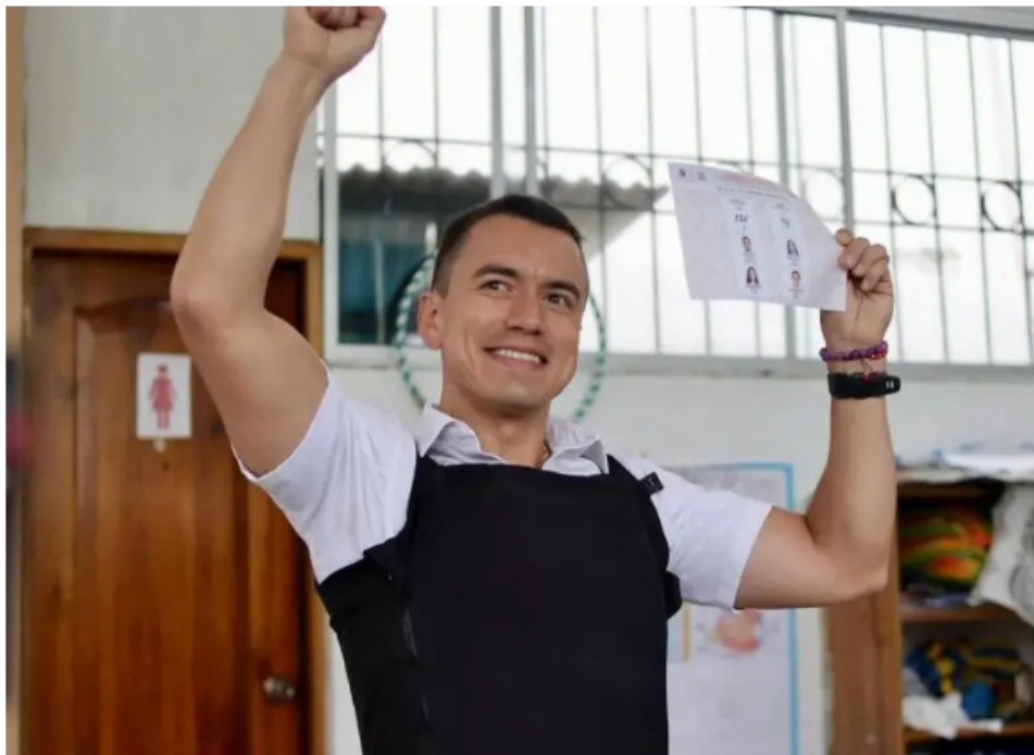
Daniel Noboa, presidente de Ecuador.

Los candidatos cuestionaron la falta de claridad de Noboa sobre sus planes para la nueva Constitución, que dijo revelaría únicamente después de la votación.