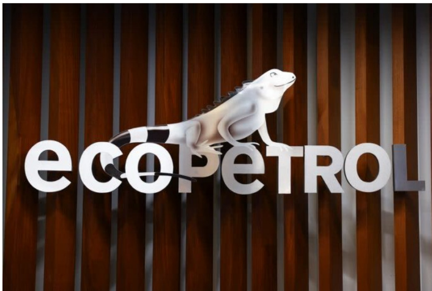
FOTO DE ARCHIVO: Logo de Ecopetrol en su sede principal en Bogotá, Colombia, Junio 24, 2025. REUTERS/Luisa González · Reuters

Bogotá, noviembre de 2025, El gobierno reportó que el Grupo Ecopetrol continúa adoptado decisiones estratégicas que garanticen el suministro de gas natural en todo el país.