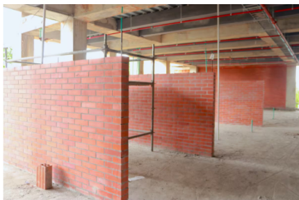
En la nueva sede de las UTS en Barrancabermeja se invierten más de $22 mil millones