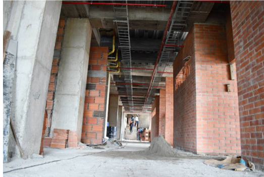
Los trabajos de la nueva sede de las UTS en Barrancabermeja avanzan en un 50 %

Siga las noticias de Vanguardia en Google Discover