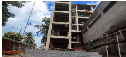
La sede de las UTS se construye en el barrio La Esperanza, en la comuna 5 de Barrancabermeja

"Se está trabajando en un otrosí de tiempo al convenio que amplía el plazo de ejecución hasta junio de 2026, con el fin de permitir la culminación de las obras pendientes y garantizar la correcta finalización de los trabajos", informó Ecopetrol.