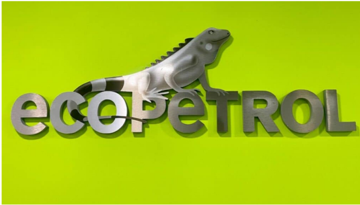
Resultados financieros de Ecopetrol.