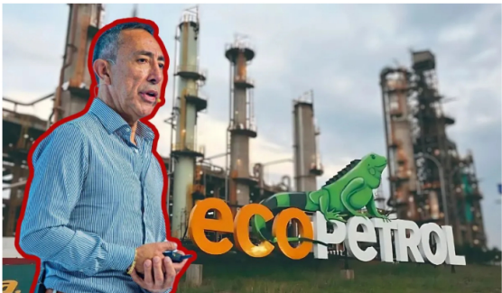
Ricardo Roa, presidente de Ecopetrol, expone la situación financiera y energética en el Congreso de Naturgas en Barranquilla.

Ecopetrol y Reficar difieren «de la interpretación de la DIAN que propende por el cobro retroactivo del IVA» y ya han interpuesto recursos de reconsideración. Además, han involucrado a la Procuraduría y la Contraloría en el proceso. El mayor temor es que la DIAN inicie un proceso de «cobro coactivo». Un evento de este tipo «podría implicar un efecto material adverso en las operaciones, liquidez y posición financiera» de la compañía. A pesar de la magnitud del riesgo, Ecopetrol informó que, basándose en conceptos de asesores externos que estiman una probabilidad de éxito superior al 50%, considera que existen argumentos para no constituir ninguna provisión contable.