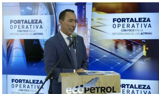
Ricardo Roa, presidente de Ecopetrol entrega resultados de la compañía en 1T2025.

Los ingresos consolidados de la petrolera estatal cayeron un 13,8% anual, ubicándose en $29,8 billones, y la utilidad neta retrocedió un 29,8% frente al mismo periodo de 2024, totalizando $2,56 billones.