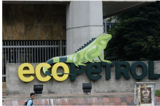
Foto de archivo de vista del logo de la petrolera estatal colombiana Ecopetrol.

Ecopetrol informó este jueves un aumento del beneficio neto en el tercer trimestre del año, cifra que alcanzó los 2,6 billones de pesos (unos 692,5 millones de dólares) y que supera en un 42% las ganancias del segundo trimestre.