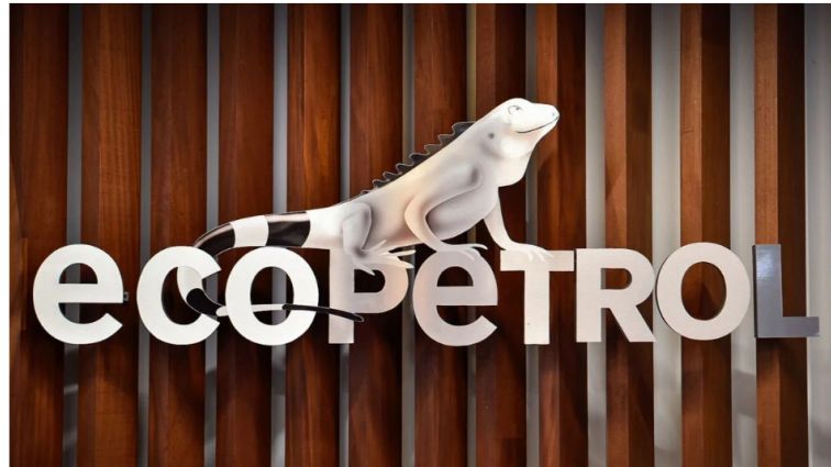
Empresa Colombiana de Petróleos (Ecopetrol).

La Empresa Colombiana de Petróleos (Ecopetrol) anunció que el 13 de noviembre cerró la adquisición del portafolio de proyectos solares que Statkraft tenía en Colombia, tras cumplirse las condiciones y requisitos legales previstos.