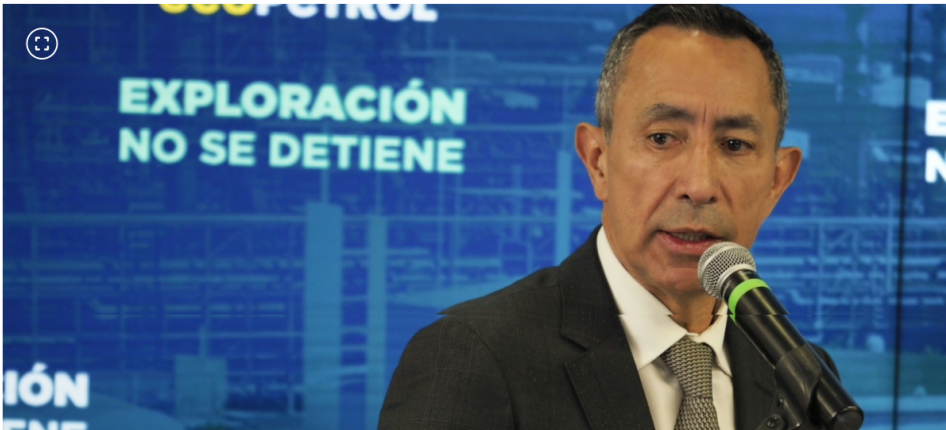
Presidente de Ecopetrol, Ricardo Roa.

Lina Quiroga Rubio PERIODISTA ECONÓMICA 14.11.2025 10:20 | Actualizado: 14.11.2025 17:54