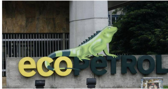
Ecopetrol destacó además que su producción de hidrocarburos en el tercer trimestre fue en promedio de 751.000 barriles de petróleo equivalentes diarios

Bogotá- La petrolera estatal colombiana Ecopetrol tuvo un beneficio neto de 2,6 billones de pesos (unos 692,5 millones de dólares) en el tercer trimestre del año, resultado que supera en un 42 % las ganancias del segundo trimestre, informó este jueves la compañía.