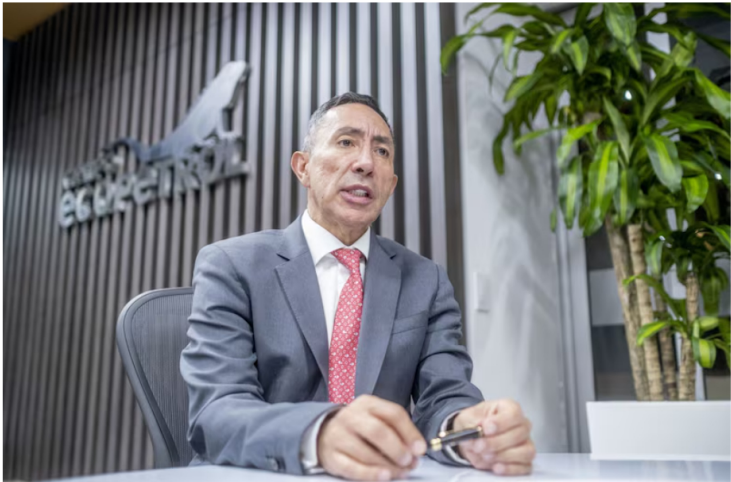
Utilidades de Ecopetrol cayeron 32% a COP$7,5 billones entre enero y septiembre de 2025. En la imagen, Ricardo Roa, presidente de Ecopetrol.

La petrolera estatal colombiana indicó que el 76% de esta caída se explica por factores de mercado externos al Grupo, principalmente la reducción del precio del Brent (-15%).