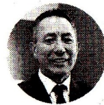
Ricardo Roa Presidente de Ecopetrol

"Los resultados alcanzados en este periodo nos ubican en una sólida posición para cumplir nuestras metas operativas y financieras previstas para 2025".