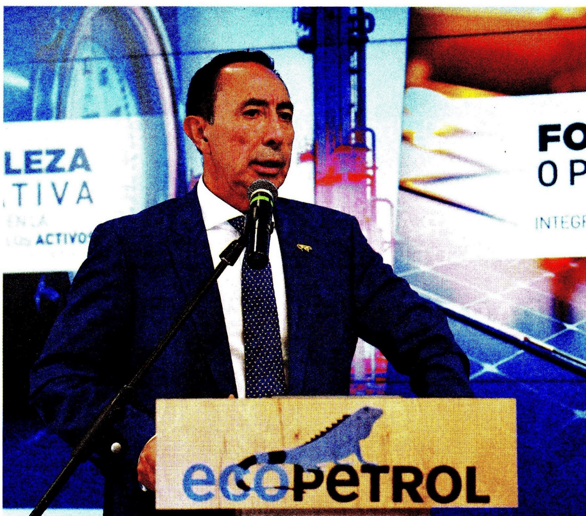
Ricardo Roa, presidente de Ecopetrol, destacó el plan de ahorros y eficiencias.

» La empresa defendió que el golpe en los ingresos se debe a la caída del precio del petróleo.