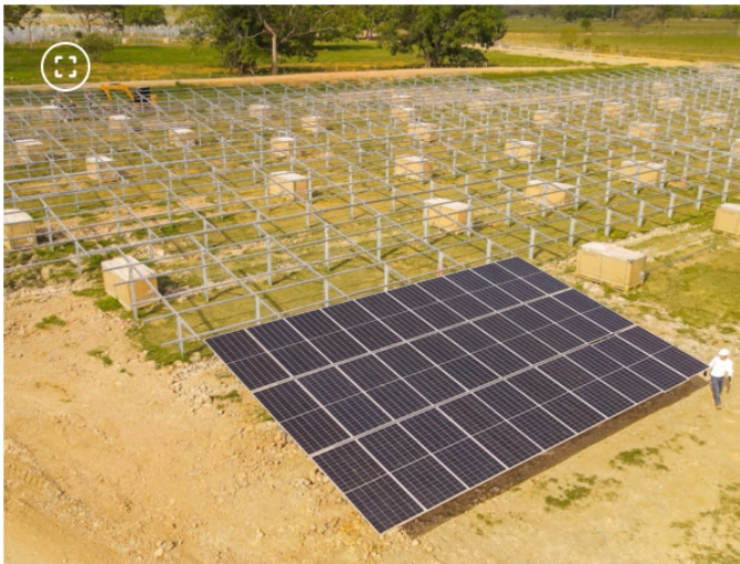
Granja solar La Iguana

En la línea de negocios de Energías para la Transición, las directivas indicaron que se inició operación la granja solar La Iguana, proyecto con capacidad de 26 MW que fortalecerá el suministro eléctrico de la refinería de Barrancabermeja y contribuirá a la descarbonización de sus operaciones.