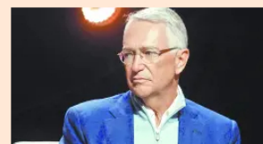
Opinión Suprema Corte desecha amparos de Grupo Salinas por 34,737 mdp EL ECONOMISTA

Coordinadora amaga con boicot al mundial de la FIFA