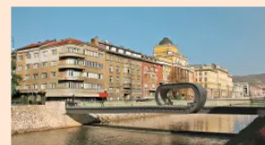
Opinión "Sarajevo Safari": cacerías humanas de civiles en los 90' EL ECONOMISTA