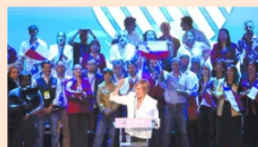
Opinión Chile va a las urnas con temor a la inseguridad EL ECONOMISTA