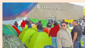
Opinión Coordinadora amaga con boicot al mundial de la FIFA EL ECONOMISTA

EU abre nueva fase de ofensiva antidrogas en el Caribe