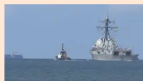
Opinión EU abre nueva fase de ofensiva antidrogas en el Caribe EL ECONOMISTA