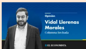
Opinión Vidal Llerenas Morales Columnista invitado EL ECONOMISTA