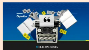
Opinión La Gran Carpa EL ECONOMISTA