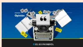
Opinión R. Velasco ingresa a la Academia Mexicana de Derecho Internacional EL ECONOMISTA