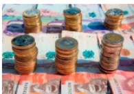
Vision estrategica RSE 2025

“Siempre es importante tener algo de exposición a oro, criptomonedas, Standard & Poor’s 500 y acciones colombianas como Éxito, Davivienda, Grupo Energía Bogotá o ISA”, explica. Para Suárez, el 2026 será un año para mantener posiciones en sectores sólidos y aprovechar los movimientos del mercado global, con una dosis razonable de riesgo .