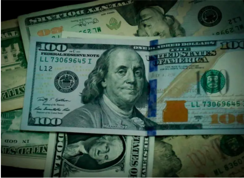
La recomendación final de los analista es diversificar, modernizar los portafolios y actuar con cabeza fría.

riesgos geopolíticos y ajustar los portafolios será clave para invertir con éxito.