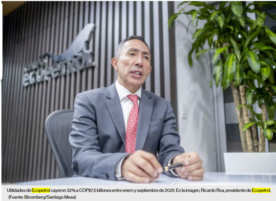
Utilidades de Ecopetrol cayeron 32% a COP$7,5 billones entre enero y septiembre de 2025 En la imagen, Ricardo Roa, presidente de Ecopetrol .

La petrolera estatal colombiana indicó que el 76% de esta caída se explica por factores de mercado externos al Grupo, principalmente la reducción del precio del Brent (-15%).