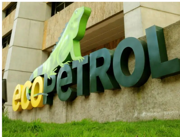
Ecopetrol concentrará la atención del mercado en 2026 por elecciones y caída de utilidades, clave para la estrategia petrolera de Colombia.