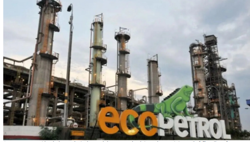
La representación de los trabajadores debe tener el mínimo de requisitos

Los trabajadores de Ecopetrol, la principal empresa estatal del país, tendrán la oportunidad de elegir a uno de sus compañeros como representante en la junta directiva de la compañía. Así lo confirmó el ministro de Hacienda, Germán Ávila , quien destacó que esta decisión busca fortalecer el vínculo entre la dirección de la empresa y su base laboral.