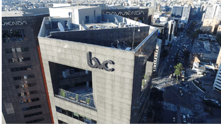
Ecopetrol sobresale entre acciones de la Bolsa de Valores de Colombia a mirar en 2026. Por cuenta del cambio de gobierno que se aproxima y del rumbo que tome frente a la explotación de hidrocarburos, la estatal colombiana estará en el radar. (BVC)

Por cuenta del cambio de gobierno que se aproxima y del rumbo que tome frente a la explotación de hidrocarburos, la estatal colombiana estará en el radar.