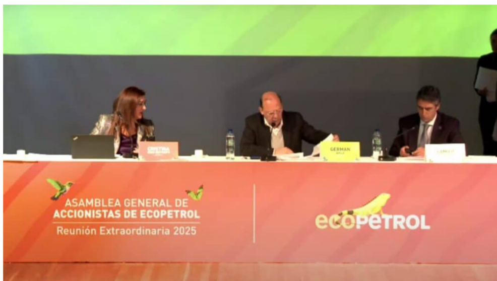
Asamblea Extraordinaria de Accionistas de Ecopetrol 2025.