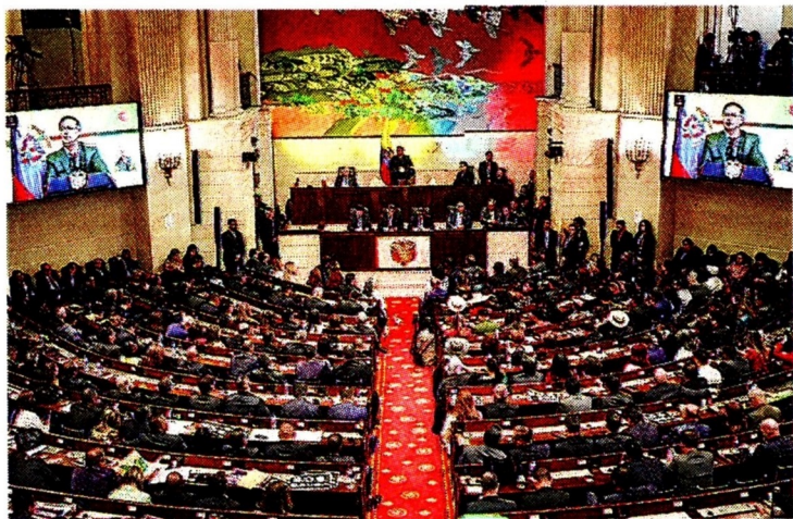
Congreso de la República

Ponentes se reunirán para discutir la tributaria