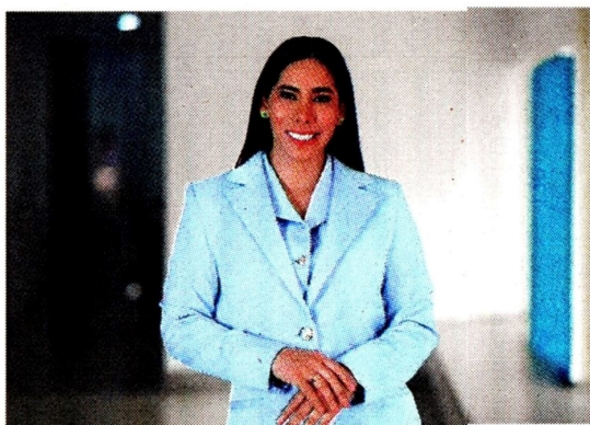
Ministerio de las TIC

El Ministerio de las TIC, con la titular Carina Murcia , y la Universidad de Cartagena anunciaron la conclusión de la primera cohorte del "Diplomado en Fortalecimiento de Habilidades y Herramientas de Inteligencia Artificial para el Sector Público". Este programa fue diseñado para dotar a los servidores públicos de las capacidades para la transformación digital aprovechando herramientas tecnológicas. (LM)