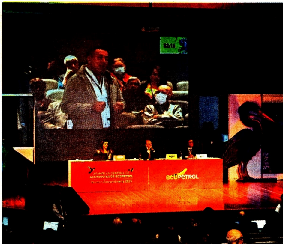
Foto de la asamblea extraordinaria de accionistas de Ecopetrol que se realizó ayer.

Entre las modificaciones adoptadas se destacan tres