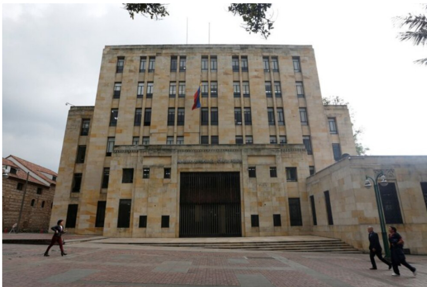
El nombre será remitido al Ministerio de Hacienda y Crédito Público para su incorporación oficial

El nuevo esquema establece que en las elecciones de la Junta Directiva de Ecopetrol , el séptimo puesto de la lista propuesta por la Nación corresponderá a una persona trabajadora elegida directamente entre los empleados de la empresa. Ese nombre será remitido al Ministerio de Hacienda y Crédito Público para su incorporación oficial.