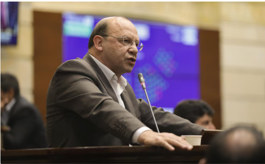
Germán Ávila, ministro de Hacienda

Otro de los cambios adoptados reconoció la experiencia operativa y permitió sustituir el requisito de experiencia internacional previa por conocimientos en áreas como la actividad industrial, comercial, financiera, jurídica, bursátil o de riesgos empresariales.