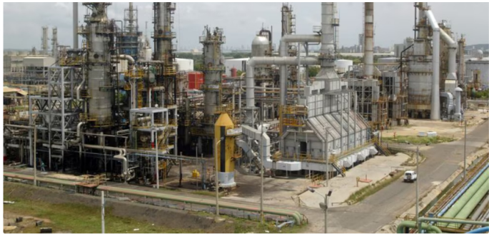
Reficar (Refinería de Cartagena) es un activo industrial clave para la soberanía energética de Colombia - crédito Fredy Builes/Reuters