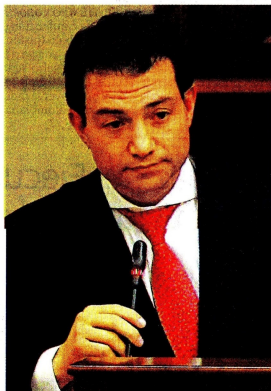
Carlos Felipe Córdoba, excontralor general de la República de Colombia.