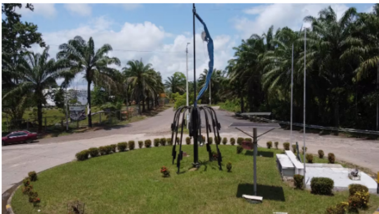
Bloqueos en La Cira-Infantas, el principal campo petrolero de Santander: ¿cuáles son los motivos?

Asimismo, voceros de la protesta han señalado que otra de las peticiones es el ajuste en el pago de los salarios .