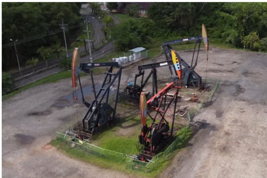
Bloqueos en La Cira-Infantas, el principal campo petrolero de Santander: ¿cuáles son los motivos?

Siga las noticias de Vanguardia en Google Discover