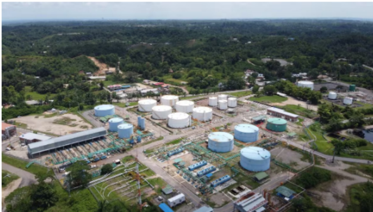
Bloqueos en La Cira-Infantas, el principal campo petrolero de Santander: ¿cuáles son los motivos?

La Cira-Infantas también es reconocido como el primer campo petrolero en el país, perforado a principios del siglo XX.