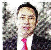
RICARDO ROA PRESIDENTE DE ECOPETROL

El sábado 15 de noviembre se habilitará al menos un carril en el kilómetro 18 en la Vía al Llano. Según el Ministerio de Transporte, esta será la medida para restablecer parte de la movilidad en la región.