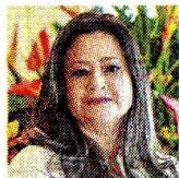
MARÍA FERNANDA ROJAS MINISTRA DE TRANSPORTE

El sábado 15 de noviembre se habilitará al menos un carril en el kilómetro 18 en la Vía al Llano. Según el Ministerio de Transporte, esta será la medida para restablecer parte de la movilidad en la región.