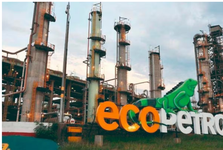
Petro insiste en que Ecopetrol venda participación en el Permian: ¿qué implicaría para el país? | Colprensa

Siga las noticias de Vanguardia en Google Discover