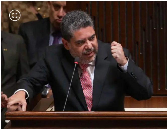
Carlos Hernán Rodríguez, Contralor General de la República.

El jefe del organismo de control advirtió que, de confirmarse un proceso de venta sin el sustento técnico adecuado, podría configurarse un eventual detrimento patrimonial. “Estamos obligados a revisar si una acción sobre este importante recurso puede representar un riesgo para el país” , explicó, y agregó que los resultados de la auditoría serán revelados antes de la segunda semana de diciembre.