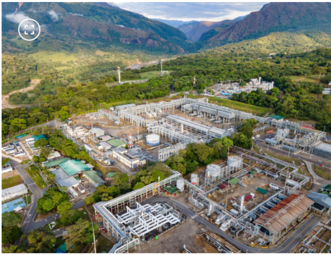
Campo Floreña de Ecopetrol

Este esquema se definió al considerar que estos son los únicos departamentos del país que cuentan con la cobertura del 100 por ciento de la demanda residencial y de pequeños comercios.