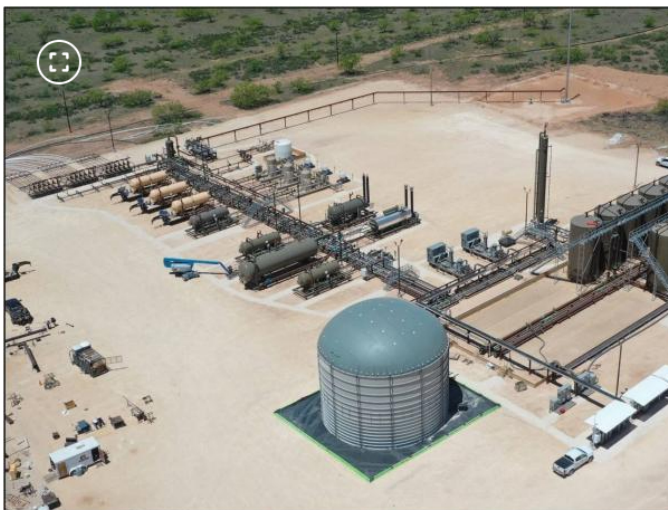
Operaciones de fracking de Ecopetrol en Estados Unidos.

Ecopetrol y Petrobras afrontan varios desafíos en Sirius que generan serias dudas sobre el inicio de su producción de gas natural en 2030