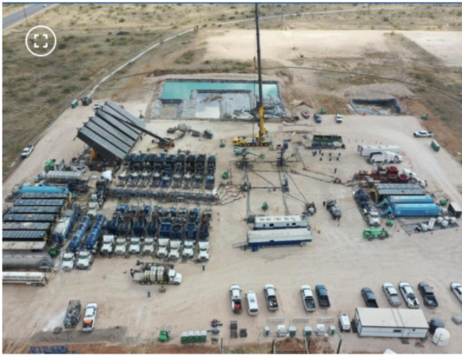
Operaciones de fracking de Ecopetrol en Estados Unidos.

Adicionalmente, la compañía manifestó que tampoco “ha puesto a consideración de su junta directiva una posible desinversión y/o propuesta de venta de su participación en la cuenca del Permian” .