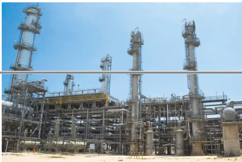
Foto de la Refinería de Cartagena.