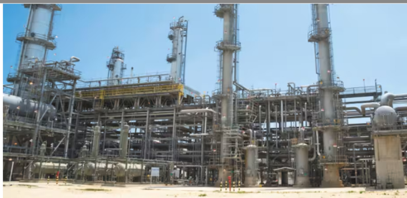
Foto de la Refinería de Cartagena.