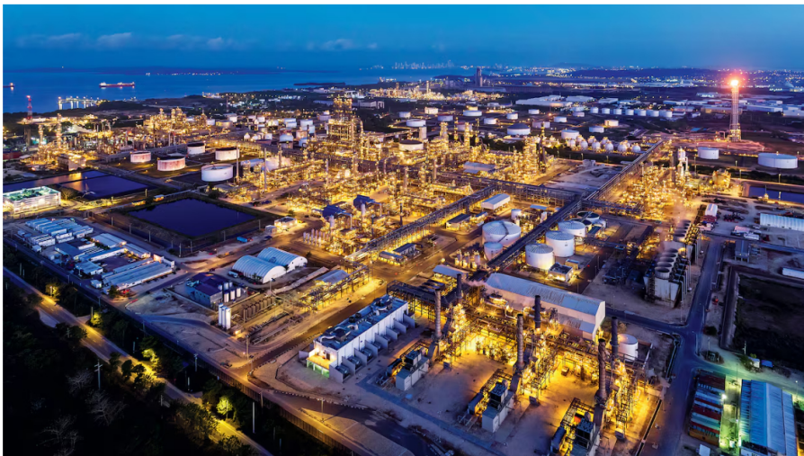
La decisión de la Dian podría conducir a dejar a la Costa Atlántica sin diésel ni gasolina jet, inicialmente. Reficar procesa 200.000 barriles diarios y más de 2.300 personas trabajan de manera directa.

A finales de 2024, la Dirección de Impuestos y Aduanas Nacionales (Dian), sorpresivamente, emitió un concepto en el cual se estableció que la importación de gasolina y diésel tendría que pagar un IVA de 19 %.