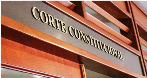
La Corte Constitucional tumbó el artículo que prohibía deducir las regalías del impuesto sobre la renta para las empresas de petróleo y carbón, declarándolo inconstitucional.

Acuerdo General de Aranceles y Comercio (GATT), del cual hacen parte hoy más de 160 países y que tienen una participación del 98 % del comercio mundial. Este acuerdo exige publicación previa y prohíbe aplicar con efectos anteriores a su publicación las leyes, reglamentos y disposiciones administrativas de aplicación general relativas a derechos de aduana, procedimientos más gravosos y cargas conexas en la importación.