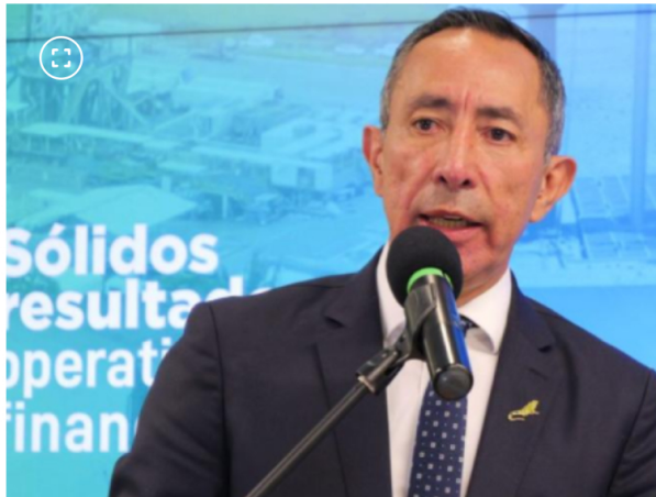
Ricardo Roa, presidente de Ecopetrol.

"Nosotros esperamos que esto se resuelva a favor de Reficar y Ecopetrol y que, en definitiva, no generemos una crisis inducida simplemente por un tema tributario que no tiene, entre otros, mucho sentido", agregó.