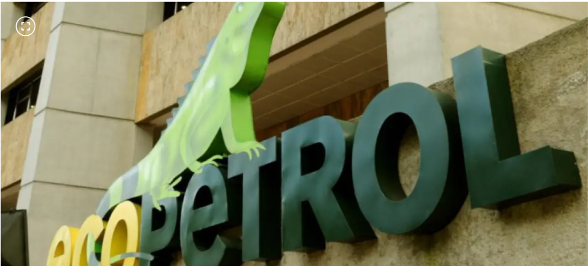
Se mantiene la disputa entre Ecopetrol y la Dian.

Hasta el momento la Dian no ha decidido si embarga o no los recursos de la refinería de Cartagena.