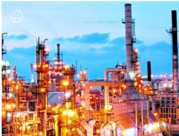
Reficar realizará su mantenimiento entre el 10 y el 14 de octubre del 2025.

Entre tanto, resaltó que el gobierno sí está desesperado en medidas que han demostrado ese afán para recaudar caja.