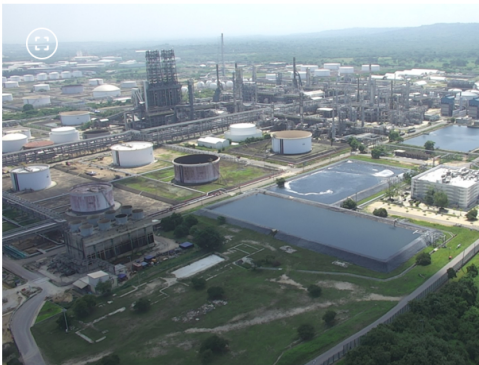
Refinería de Cartagena (Reficar)

Todo este pleito comenzó por una reinterpretación que está haciendo la Dian del Estatuto Tributario, específicamente sobre el IVA que las compañías deben pagar por la importación y nacionalización de gasolina y diésel.