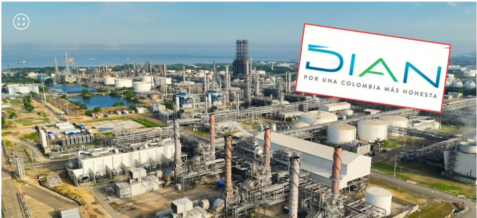
Refinería de Cartagena (Reficar)

La Dian pretendía embargar las cuentas bancarias de Reficar para cobrarse esta “deuda”. Ecopetrol enfrenta un problema similar.