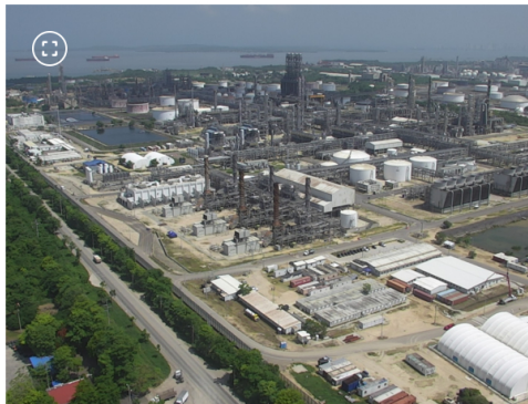
Refinería de Cartagena (Reficar)