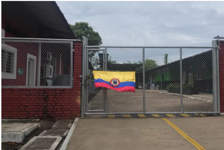
El bloque de los conductores afecta las operaciones y la producción del campo La Cira - Infantas de Barrancabermeja..

Siga las noticias de Vanguardia en Google Discover