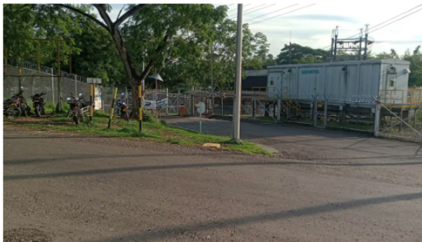
Desde el pasado 28 de octubre, conductores mantienen bloqueos en los accesos al campo petrolero La Cira-Infantas de Barrancabermeja.

El gremio también pide que se cumplan los acuerdos firmados en el Acta de Compromiso del 26 de noviembre de 2024. En ellos se establece que Ecopetrol debía garantizar que todas las compañías aplicaran las mismas condiciones laborales y de pago a los conductores, y que no se iban a permitir ofertas con precios por debajo de los valores establecidos en la guía laboral.