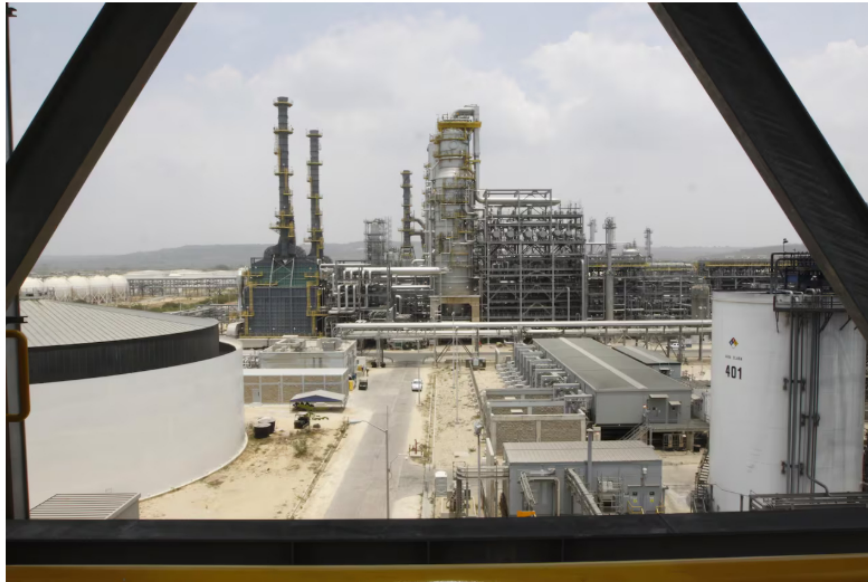
La operación de Reficar está en entredicho ante el cobro coactivo de la Dian.

Desde ayer, Ecopetrol alista una batería jurídica para evitar los cierres y tener que apagar las refinerías y los campos. Los mecanismos jurídicos son a través de tutelas, una radicada el miércoles en la tarde por parte de la empresa y otra que instaurará la Unión Sindical Obrera (USO) para proteger el empleo y por el derecho al trabajo de más de 2.000 empleados. Además, habrá una demanda de nulidad ante el Tribunal Administrativo de Bolívar contra la decisión de la Dian.