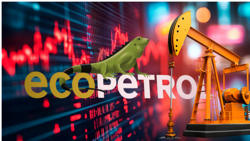
En cumplimiento de esta determinación, Ecopetrol ha cancelado en impuestos en 2025, cerca de 550 millones de dólares.

Sin embargo, la Dian empezó a aplicar esta medida con retroactividad para los años 2022, 2023 y 2024, y la cifra para esas tres vigencias suma 1,5 billones de pesos.