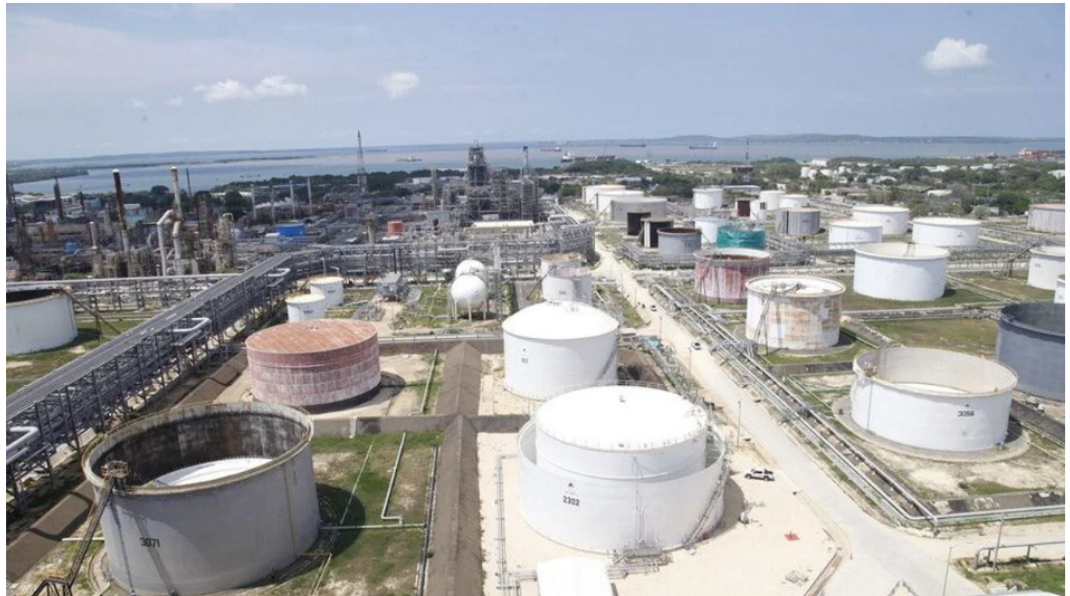
Refinería de Cartagena

La FM conoció que en la Refinería de Cartagena , la más grande del país, hay una crisis tras varios oficios de la DIAN con la orden de pago de alrededor de 1.3 billones de pesos por IVA a combustible importado, diésel y gasolina desde 2022.