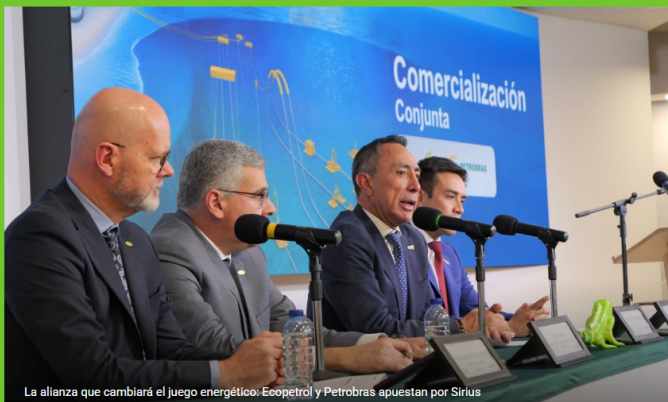
La alianza que cambiará el juego energético: Ecopetrol y Petrobras apuestan por Sirius

Home / 2025 / noviembre / 4 / La alianza que cambiará el juego energético: Ecopetrol y Petrobras apuestan por Sirius