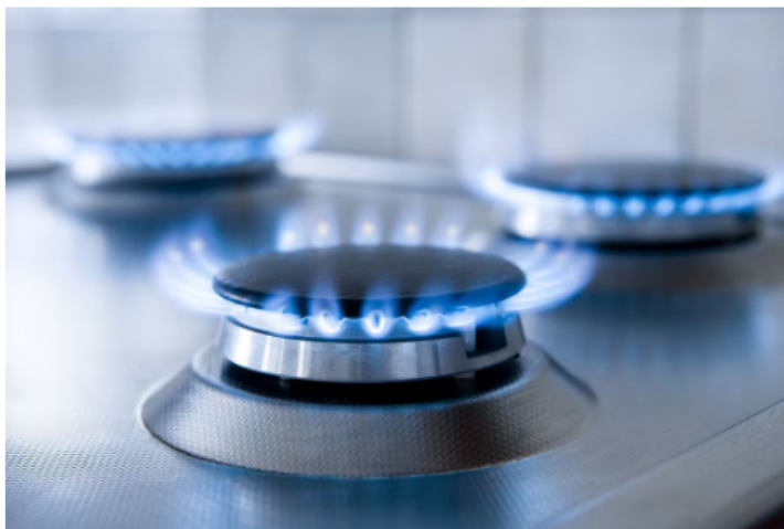
Imagen de referencia sobre el gas natural.

La entrada de ese gas es clave para el país. Desde finales de 2024, Colombia tuvo que acudir a la importación de gas para cubrir la demanda en los hogares, comercios e industrias. Si bien el país importaba gas desde 2016, esto solo se hacía para atender la necesidad de las generadoras de energía que lo requerían.