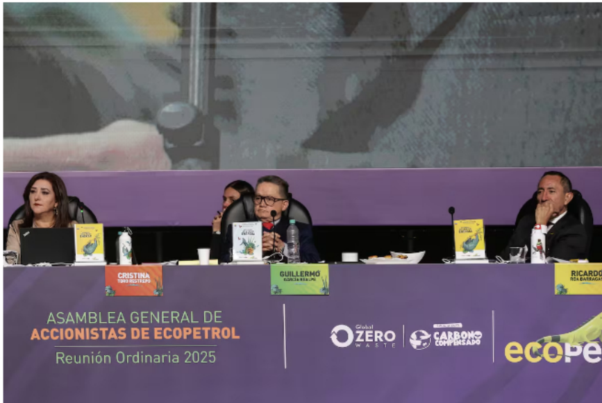
En las instalaciones de Corferias se llevó a cabo La Asamblea General de Accionistas de Ecopetrol 2025.