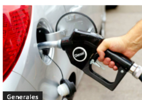
Generales Gobierno eliminará el subsidio al diésel para 360 mil camionetas de lujo, sin afectar el transporte de carga