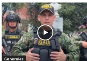
Generales Rescatan a médico en Cundinamarca: pedían $40 millones por su liberación