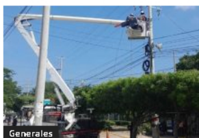
Generales Adecuaciones técnicas en la subestación Río Córdoba y Tenerife