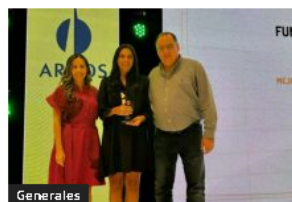
Generales Fundación Gases del Caribe recibe Premio Regional a la Responsabilidad Social Camacol 2025